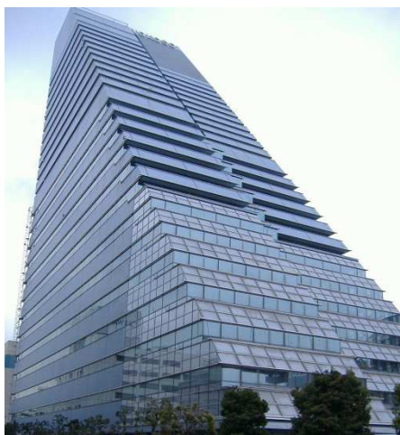
ヨコソーレインボータワー