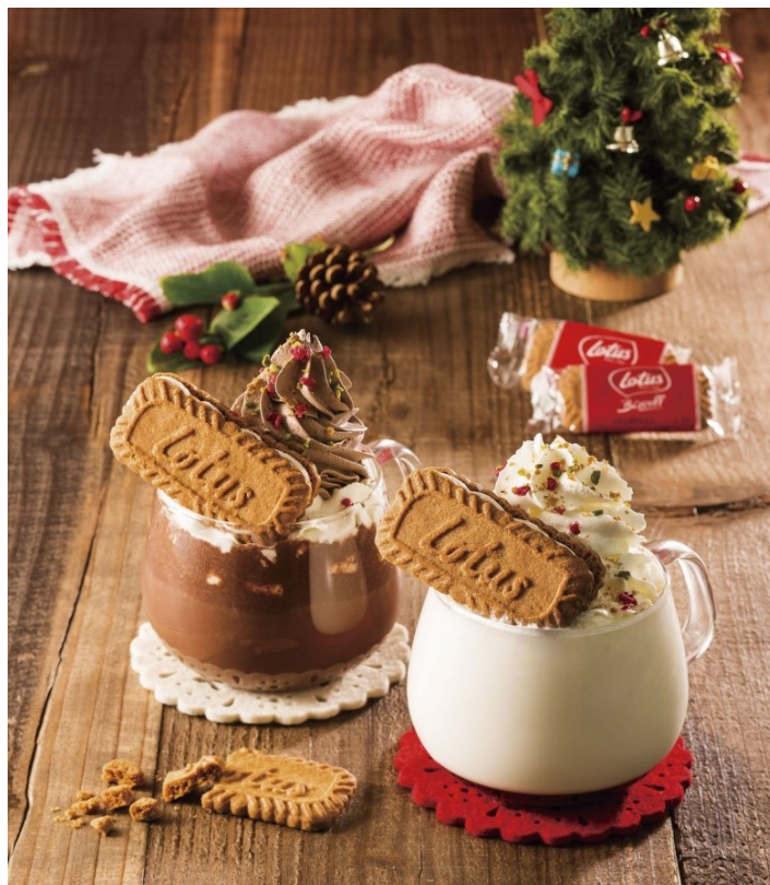
コラボクリスマスドリンク・イメージ: (左から)クリスマス・ブラックモカ with ロータスビスコフ・スモア クリスマス・ホワイトラテ with ロータスビスコフ・スモア